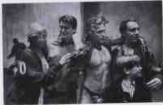
Derek Jarman (a la derecha) durante la filmación de Eduardo II .

militante gay. La escenografía y vestuario trasladan la acción del siglo XIV a la actualidad (en que se mezclan la psicodelia de los 60 con el glam-rock de los 80), con el objeto de dejar en claro la universalidad atemporal del alegato en favor de la homosexualidad.