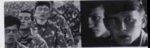
Escenas de Spiritual voices , de Sokurov.

El trío protagonista, encarnado en 1967 por Federico Lupi, Elsa Daniel y María Vaner, estuvo a cargo ahora de tres bailarines. "Aniceto" fue integra- mente filmada en los interiores de un gigantesco galpón. Todo lo que el espectador ve es "artificio" (en el sen- tido más teatral del término). Las il- limitadas posibilidades que un ámbito de este tipo ofrece desde el punto de vista fotográfico y escenográfico son aprovechadas al máximo por Favio. Cada espacio está diseñado e ilumina- do con tal vuelo plástico que el resultado es una sucesión ininterrum- pida de imágenes cuya sofisticación raya en lo inverosímil (sobre todo cuando se tiene conciencia de que no ha habido intervención digital de ningún tipo: todo lo que vemos es