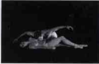
Escena de la segunda versión de El romance del Aniceto y la Francisca , de Leonardo Favio.

"verdadero"). El desborde visual propio de Favio como artista domina cada escena, cada plano. La historia trágica de Aniceto, Francisca y Lucía constituye una mera excusa para que el director componga una auténtica "sinfonía audiovisual". Tal enunciación sinestésica no es arbitraria. La música del film (que remite estilísticamente en forma reconocible a la de otros filmes de Favio) establece una estrechísima relación con la imagen, enfatizada por el muy elaborado ritmo del montaje. Aniceto es concebido como un film básicamente para "contemplar": los sentidos por sobre la razón.