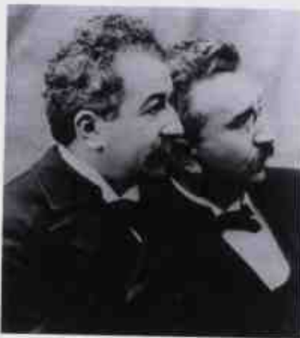
Los hermanos Lumière.

Prof. y Lic. en Letras, FFyL, UBA. Prof. Asoc. de Diseño y Comunicación Audiovisual I, II y III, carrera de Diseño de Imagen y Sonido, UBA.